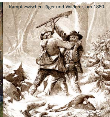
Kampf zwischen Jäger und Wilderer, um 1880.