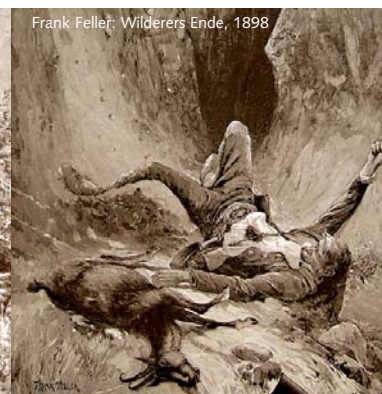
Frank Feller: Wilderers Ende, 1898