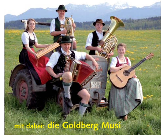
mit dabei: die Goldberg Musi