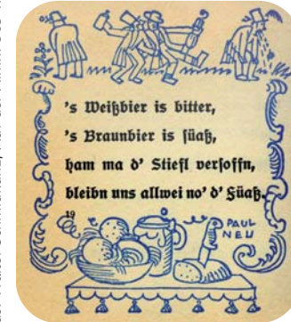
Illustration: Paul Neu, aus: Walter Schmidkunz, Auf der Alm... 365 waschechte Schnaderhüpferln

Queri wettert gegen das Klischee vom „Roman-Bayern“ und möchte ihm die „echten Dokumente des Volkslebens“ gegenüberstellen. Seine satirisch-humoristischen Schriften, darunter die „Schnurren des Rochus Mang“, „Die weltlichen Gesänge des Egidius Pfanzelter von Polykarpzell“ und