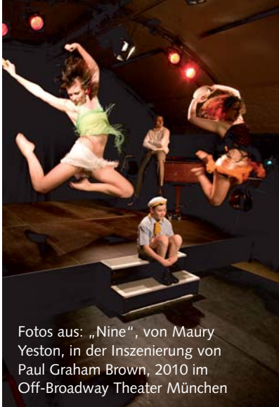
Fotos aus: „Nine“, von Maury Yeston, in der Inszenierung von Paul Graham Brown, 2010 im Off-Broadway Theater München

Volkstümlichkeit, Gesellschaftskritik und Evergreens. Von der deutsch-österreichischen Operette des 19. Jhs. übernahm das Musical die weit entwickelte formale Struktur. Und die Broadway-Produzenten haben sich von den großen Pariser Ausstattungs-Revuen anregen lassen.