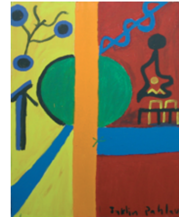
„Die Kuh im Wald“, Jaklin, 2000, Acryl auf Leinwand, 100 x 80 cm

Jaklin sagt immer. Hört man nicht. Jaklin sagt immer. Hört man gern Jaklin sagt Etwas. Ist Richtig Jaklin weißt Immer. Ist großartig Jaklin weint nie. Und weiterhin alles gute. Ende von Jaklin