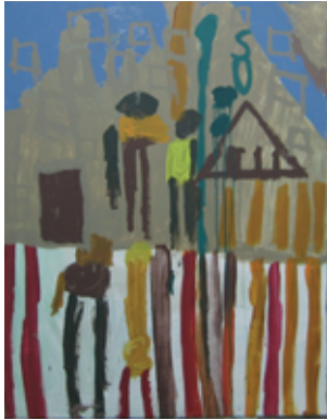
„Rathausplatz München“, Martin Kaiser, 2000, Acryl auf Leinwand, 80 x 100 cm

arbeitet seit 19 Jahren künstlerisch mit einem im Kern konstanten Personenkreis aus einer psychiatrischen Klinik im Großraum Hannover. Diese Menschen kommen aus dem Langzeitbereich und leben größtenteils seit Jahrzehnten in dieser Psychiatrie. Vier Mal wöchentlich werden sie von uns zum kreativen Arbeiten in das AuE-Atelier nach Hannover aus der Klinik abgeholt. Ein Malereitermin findet wöchentlich im Sprengel Museum Hannover statt. Unsere Medien sind Theater, Schreiben, Musik und Malerei.